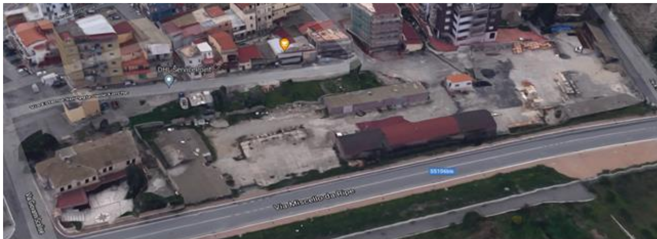
Area demaniale destinata a nuova Sede Questura e Polizia Stradale Crotona(KR)

Ufficio 5 – Tecnico Amministrativo per la Regione Calabria – Sede Coordinata Catanzaro Settore Tecnico di Crotona – Vibo Valentia